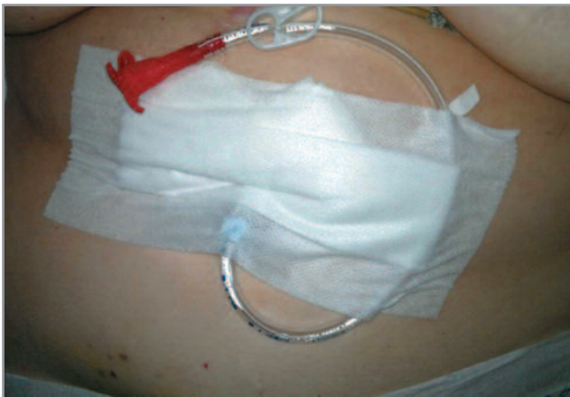
Рис. 2. Внешний вид больной с разрывом церебральной аневризмы с установленной гастростомой (указана стрелкой).