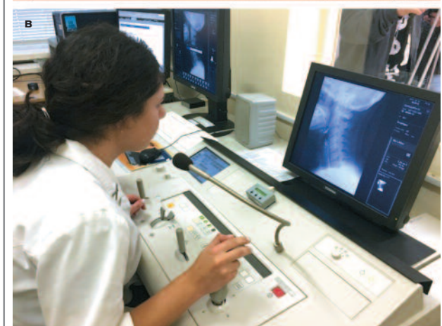
Рис. 4: а – внешний вид больной с ОНМК, перенесшей тяжелую дисфагию (трахеостомическая трубка удалена на время осуществления исследования) при проведении видеофлюорографии; б – жидкости с модифицированной консистенцией и вязкостью (Фрезубин крем, Фрезубин йогурт, Фрезубин сгущенный 2 и 1-й ступени) с добавлением контрастного вещества для проведения видеофлюорографии; в – визуализация фаз акта глотания во время проведения видеофлюорографии при помощи жидкостей с контрастным веществом.